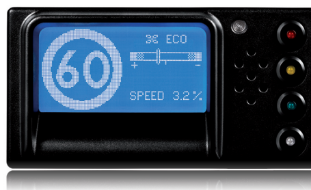
tydligt förarstöd i fordonet