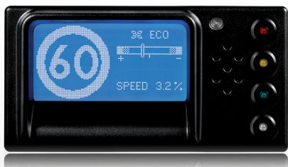
ExyPlus ger föraren ett tydligt stöd i fordonet

Kontakta oss på Sepab för ytterligare information om dessa Tillval!